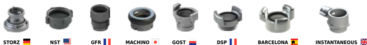
STORZ NST GFR MACHINO GOST DSP BARCELONA INSTANTANEOUS

PLA_01076_FlyerRU-EN_РАЗВЕТВИТЕЛИ, ВОДОСБОРНИКИ (КОЛЛЕТОРЫ) и КЛАПАНА_DividersSiameses&Valves