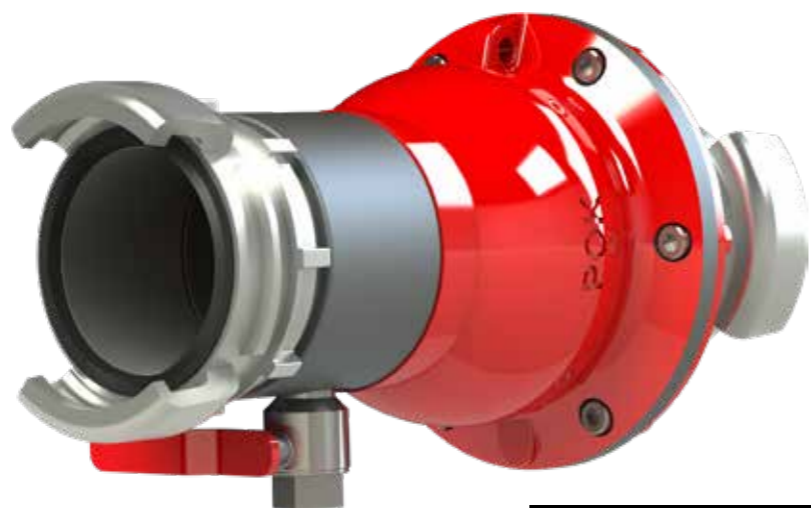
▶ ОСЕВОЙ ОБРАТНЫЙ КЛАПАН Axial valve